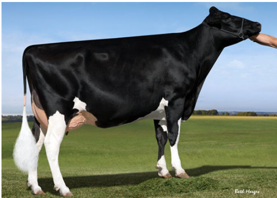
DANHOF DETROIT DASHING