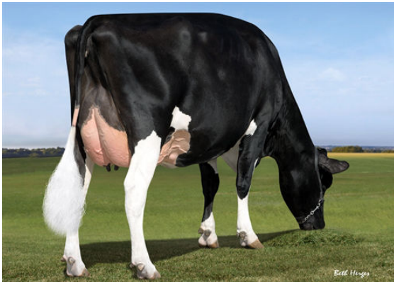
DANHOF DETROIT DASHING